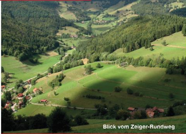
Blick vom Zeiger-Rundweg

Länge: 4,9 km Höhenmeter: 260 m Durchschnitt-Steigung: 12% Startpunkthöhe: 820 m Schwierigkeit: leicht Kinderwagen geeignet: ja